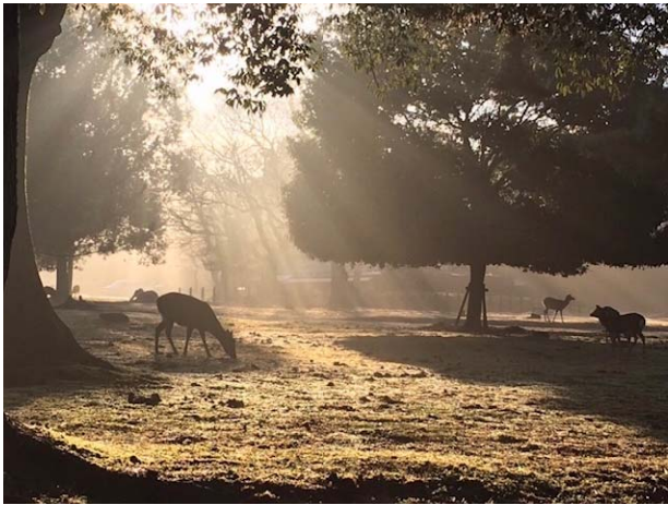
受賞作品『朝の奈良公園』